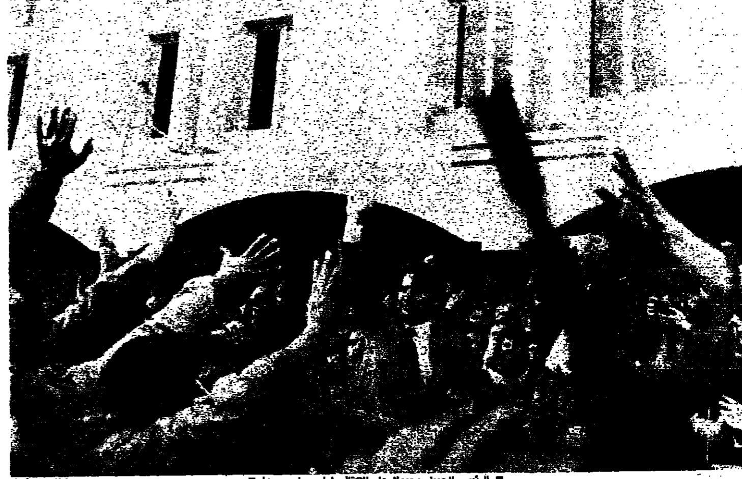
الاجتماع في صيدا مع الجنرال بديع ووزير الخارجية الايطالي جوليوني